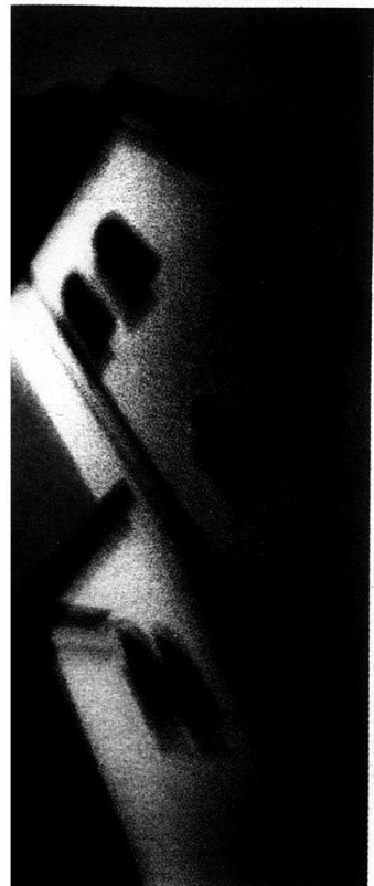
en av dödshjälp, abort och kannibalism.

krets än expertisen, vilket naturligtvis är bra med tanke på de viktiga frågeställningarna. Men frågan är om inte ämnets natur reducerar läsekretsen. Det brukar inte vara en vinnare att med bordsdamer på en middag diskutera i vilka fall det är berättigat att döda spädbarn.