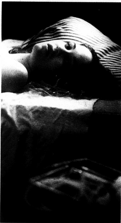
Filmerna Traffic framhäver föräldrarnas viktiga roll i kampen mot droger. Den tanken passar dåligt in i den svenska modellen som näst intill har avskaffat familjen.

I filmen uttrycker en klarsynt yngling den brutala sanningen: En armé av fattiga