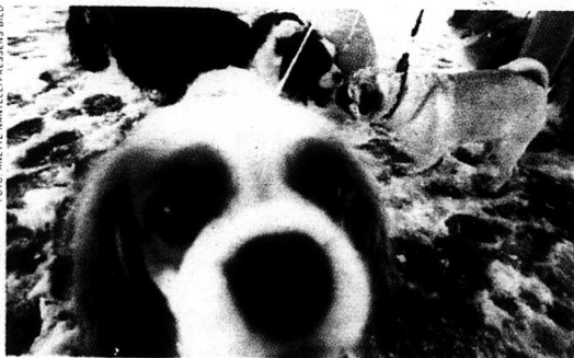
Djurs rättigheter är begränsade. Men ett husdjur är ändå mer än bara en sak.

ligt sett är det ingen skillnad på att slå ihjäl en hund och att krossa en ruta, något som många ägare av sällskapsdjur nog kan ha svårt att acceptera.