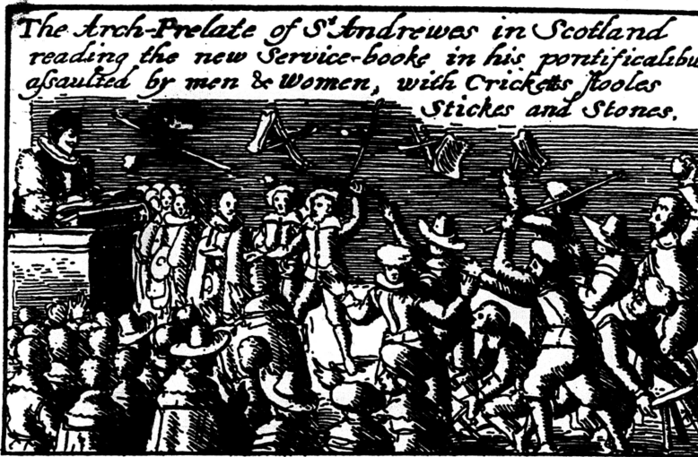
Tro och tolerans. Kung Karl I:s försök att påtvinga skottarna den engländska bönboken resulterade i övan illustrerade tumult i Edinburgh 1637. I predikstolen försöker ärkebiskopen av St: Andrew göra sig hörd. Två år senare var England och Skottland i krig.

En annan nyans, också av det passiva slaget, är likgiltighet. Låt skillnad vara skillnad. Vi bryr oss inte. Alla hundar har sin dag, även de galna. Låt folk träta och kämba bäst de gitter. Alla sorter behövs