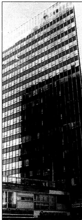
Hötorgsskräck? High-techskrapan vid Hotorget. Hot eller löfte?

Det mest intressanta med utvecklingen är kanske att "nätverket" blir den styrande metaforen för vårt organisatoriska tänkande. Staternas hierarkier blir rundningsmärken när företaget och människor själva knyter kontakter. Nationella politiker, med sina diplomater och parlamentariska restriktioner, förvandlas till onödiga mellanhänder. Samhällsekonomin integreras horisontellt och onödigt gör nationen som organisationsform.