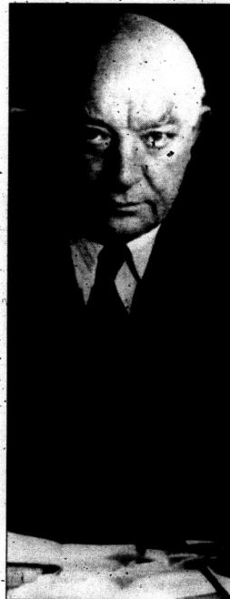
En god socialist.

Vi kan mycket väl tänka oss att vissa yrkesgrupper, trots ringa