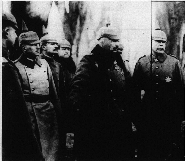
Hegeliansk filosofer karriär Ovan inspekte

Vad gjorde filosoferna med kriget? De bidrog med propaganda, och ibland mer handgripliga aktiviteter. Bergson skickades till USA för att plädера för ett amerikanskt inträde i kriget, och även om realpolitiska faktorer avgjorde saken, så var hans insatser nog inte helt betydelselösa. Haldane var under en tidigare period krigsminister i den engelska regeringen, och han verkade för något han inför förbluffade generaler