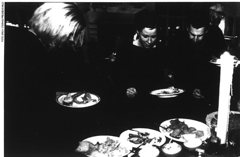
Instruktionsbok i moral saknas.

FINANSTIDNINGEN ISSN: 1100-652X VILT PRESS AB VATTENÅS 2001