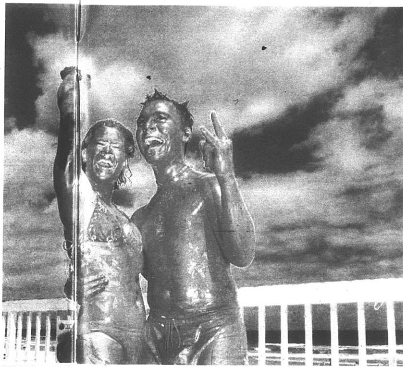
Vad är av naturen givet och