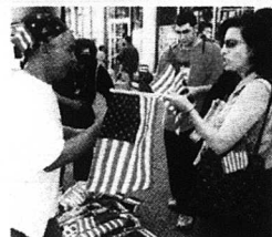
Flaggförsäljningen är på topp.