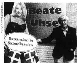
Beate Uhse blev rik på sitt sextöretag.

USA VAR NÄSTA MÅL för den tyska erotikens galjonsfigur innan hon dog. Där regerar "Hef" med sitt budskap om kärleken till de många flickvännerna. Men någon inbjudan till snedsprång var hennes pro-