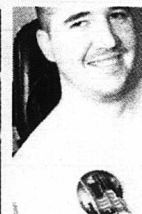
Tatuering för USA.

"Läge slav", fräser hon till budbäraren, "var det det jag frågade dig om?" Slaven meddelar då att Sparta vunnit slaget. Hon rusar till templet och framstår tackoffer till gudarna.