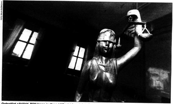
Orientligt påklädd. Rättsvans gudinna i Högsta domstolen, Stockholm.

President George W. Bush fick snabbt ta tillbaka ordet "kriget" när han startade tydligt mer energiskt bedriver han och den kristna höger som nu dominerar i politikens topp sitt kors-tåg mot omoralen i jättestatet. Det tyska veckomagasinet Der Spiegel berättar om de 135 miljoner dollar som USA:s president satsat för att avhålla sig från sex för aktenskap. Mottot är "No sex – no risk". "Särskilt ungdomar tycks ha all-lehanda problem med avhållsamhet och därför satsar statligt befordrade program på upplysning: så får USA-tonåringarna lära sig att sex utanför aktenskapet sannolikt ger skadeverkningar på kropp och själ. För att inte unga människor ska hemlösa, ska man också berätta för dem, hur man motstår sexuella lockelser. President George W. Bush är uppenbarligen övertygad om att man på detta sätt kan kväsa de unga lustar."