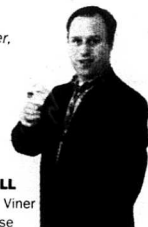
PER BILL Tidskriften Dina Viner www.vininfo.se

1990 Maily Grand Cru Brut [7307] Ett läckert och fylligt vin med fin koncentration och lång, elegant eftersmak. Drick 99-10 Pris: 279 kr 93 poäng (++)