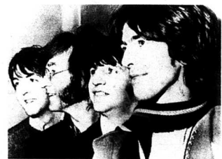
Fina gatan. Beatles kontor låg på Savile Row 3 (7).

BLANDAT Alla som har läst någon av biografierna om Bob Dylan vet att han har en hel del mindre angenäma sidor. Om man vill känna vingslagen av Dylans långsinthet kan man med bege sig till Elm Park Lane 7 i South Kensington (9). Hit ringde Bob Dylan en gång för att få sig en