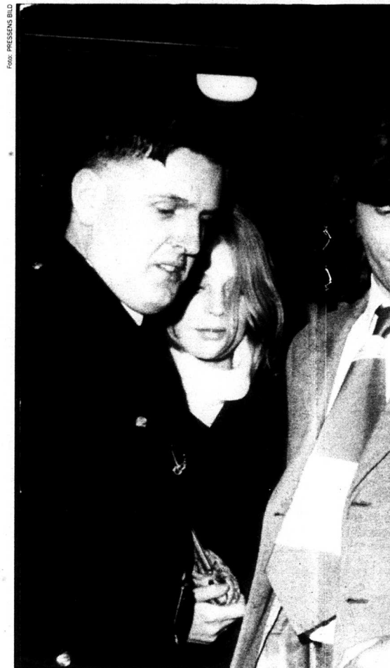
Lagens långa arm. En 25-årig Mick Jagger leds ut från domstolen på Marlborough Street i London i januari 1970. Han dömdes till 200 pund i böter för cannabisinnehav. Före detta flickvännen Marianne Faithfull friades.

Paul McCartney tillhörde också tidigt fastighets-