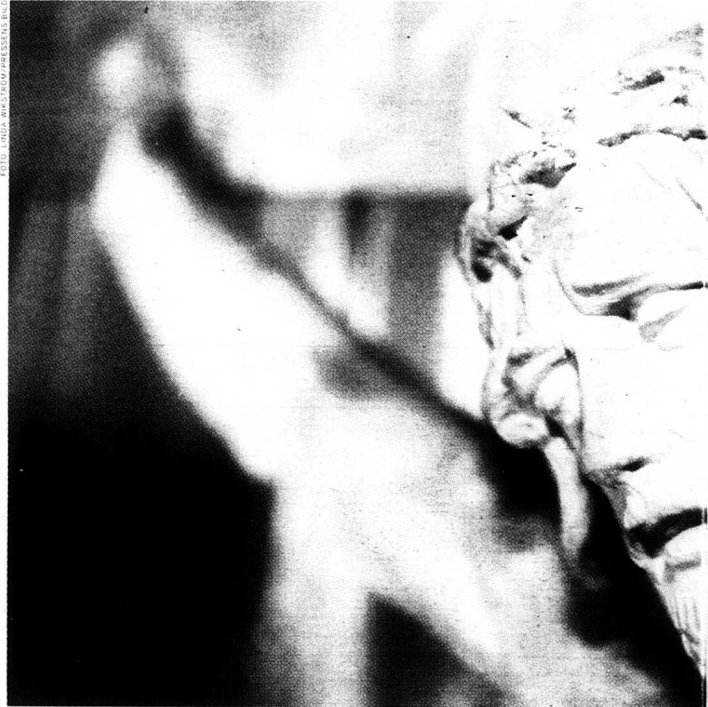
Den spanska inkvisitionen är bara ett av otaliga exempel på när trosivrarnas iver blir alltför stor och tar

särskild inkvisition i de spanska länderna.