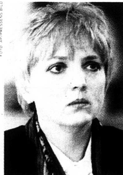
Claudia Roth, ordförande för Tysklands Gröna, vill göra politiken mysig.

Och Claudia Roths grundidéer är snarast sentimentala. De handlar om att arbeta för mjuk, mysig friggörelse. En där man visar en medkänsla som inte kostar något, fast så att man blir nöjd med sig själv. Claudia Roth vill, som hon