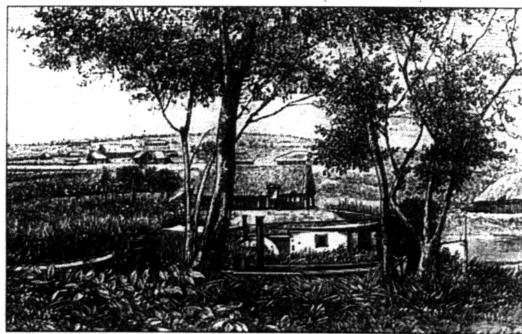
Leopoldville (Kinshasa), 1882. Illustration ur Stanleys Kongo – Den nya fristaten.

Vid det här laget hade Stanleys ambitioner nått långt bortom journalistiken. Han såg sig som en civilisationens apostel och var samtidigt angelägen om att hugfästa sitt minne med något varaktigare än papper. Han hade kartlagt den väldiga flod som de infödda kallade Zaire ("flod") från Tanganyika till Atlanten. Området tillhörde ingen europeisk makt. Varför inte skapa en ny, neutral stat, öppen för alla vita nationers handel och fria företagsamhet?