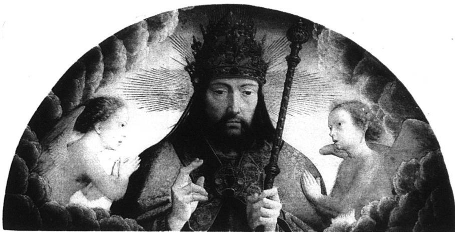
En eller flera gudar – därom tvista de lärde. Sant är att mycket bråk genom tiderna har uppstått på grund av den starka tron på en gud eller en härskare.