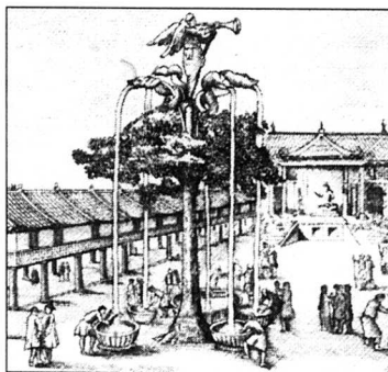
Magnifik skapelse. Dryckesfontänen från det kejsrerliga palatset är avbildad på Mongoliets 5 000-türügsedlar.

Enligt vad arkeologerna har kunnat sluta sig till av de utgrävningar som har gjorts var palatset 55 meter långt och 45 meter brett. Golvet var belagt med ljust gröna fajansplattor. Pelarna var lackerade och vilade på fundament av granit. Palatsets mest framträdande inredningsdetalj var en stor dryckesfontän i form av ett konstgjort träd, helt smitt i silver. Den rikt ornamenterade pjäsen hade skapats av en fransk guldsmed som tagits tillfångna av mongolerna i Ungern. Ryktet om denna märkliga möbel spred sig så långt västerut som till Persien.