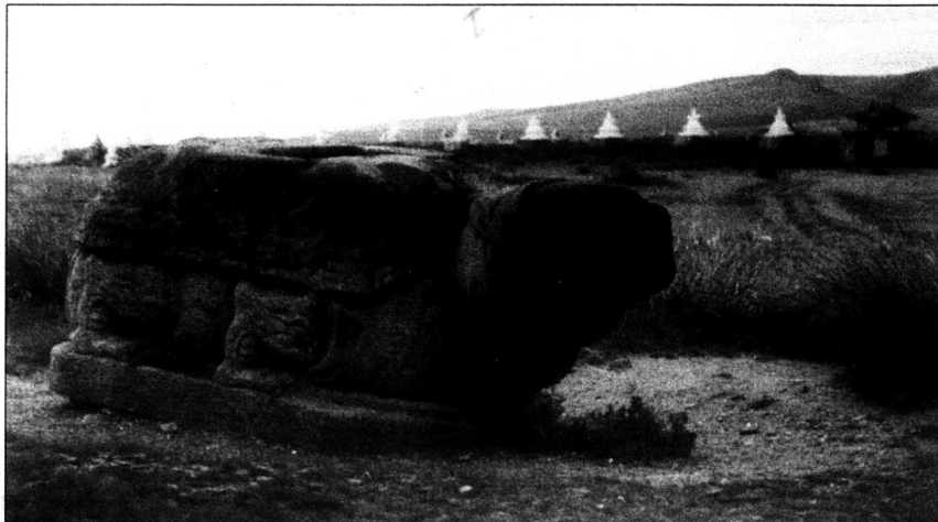
Huggen i granit. En ensam skulptur av en sköldpadda är det enda som återstår av Karakorum, staden som under några årtionden på 1200-talet var huvudstad i det största imperiet någonsin skadat. Idag består platsen endast av vidsträckt betesmarker.