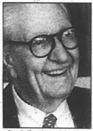
Carl Barks, 98 idag.

Och Kalle och brorsönerna ser i ned förtrytelse hur Azur Blå seglar ut ur hamn, eskorterad av den amerikanska flottan och med en svärm av flata journalister efter sig. Friheten vilar i den enkla människans händer, ankans. Regeringen och pressen är frihetens dödsgrävar.