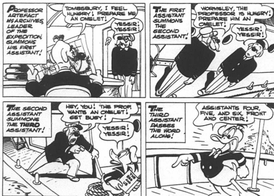
Slicka uppåt, sparka neråt. Yrkeslivets hierarkier i Vilse i Anderna .

Om sidor stöter Kalle och knattarna på Machu Picchu i Andernas dimmor. Det är en idyll som befolkas av indianer som talar sydstatsmål. Stapelfödan är fyrkantiga ägg som plockas i en dal ett stycke bort. När ankorna letar rätt på en sylta för att få sig ett klynglår så för-