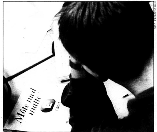
Skolexempel för besatta.

bort. Men effekten är naturligtvis inte att sådant försvinner – många går genom eld och vatten för snusk! – utan att snusket hamnar på bakgator, i cyberspace och under jorden, där det är svårare att nå dem man vill hjälpa.