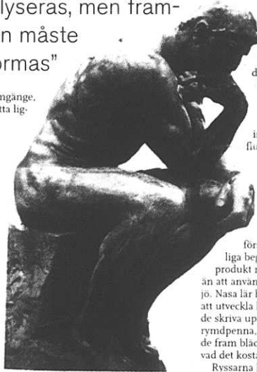
Auguste Rodins Tänkaren.

"Det förflutna kan analyseras, men framtiden måste utformas"