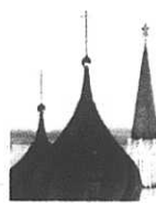
Bortom all hjälp.

MEN EN FÖRUTSÄTTNING för tröst och medkänsla är förstås att patienten gör bot och bättring. Den ryska duman återupprättade härnär dagen Aleksandrovskis gamla sovjetymn från 1943 och beslutade att göra den till det nya Rysslands nationalsång. De mäktiga tonerna belögsade de sovjetiska idrottsstrumfema över världen, men också terror, mord, förtryck och militär expansion.