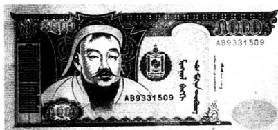
Nationalsymbol nr 1. Sedan kommunismen föll i Mongoliet har Djingis Khan blivit kult. Hans bild finns på det mesta som symboliserar nationen. Här på en 5000 tjugrög-sedel (cirka 45 kronor).

Upplýsingstidens kunskaper hämtades främst från persiska krönikörer som bevitnat mongolernas skningslösa attacker mot Samarkand, Otrar, Herat och an-