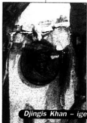
Djingis Khan - igen

När det mongoliska väldet föll samman mot slutet av 1300-talet uppstod behovet av att finna andra handelsvägar till Kina och Indien. Främre Orienten delades på nytt upp i mindre rikerna och varorna fördrades av