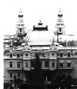
På kasinot i skatteparadiset Monte Carlo hamnar förmögden en del svenska obeskattade pengar.

Den svenska socialdemokratiska staten är speciellt sårbar för globaliseringsshotet med sina numera öppna gränser. Dess visade skattegrighet och hänsynslöshet med indrivningen gör att den för många framstår som den värsta utsgarstat. Och i den globala skattekonkurrens som redan har startat, kommer den inte att klara sig. Det håller inte längre att som hittills