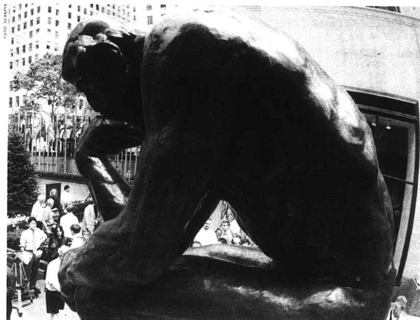
Auguste Rodins Tänkaren funderar över livets gåtor . Simon Blackburns introduktionsbok i filosofi leder ut en del av de förvirrade begreppen. Så gott det går.

der om man drar i just den där tåten där borta – rasar hela bygget då? Filosofen studerar tänkandets struktur. Det gäller att förstå hur delarna fungerar, hur de hänger samman. Det inbegriper att känna till vad som skulle hända om något vore annorlunda (därför filosofernas intresse för långsökt tankeexperiment och exempel).