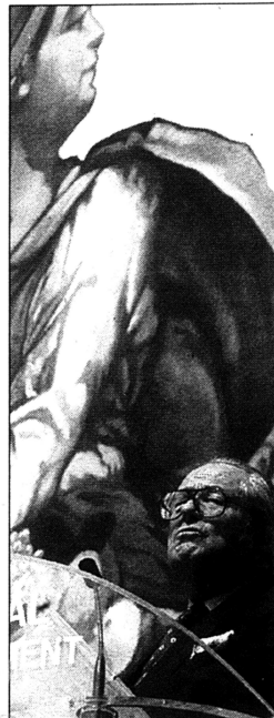
Fenomenet Le Pen. Villrådigheten kring hur han ska bemötas tilltar. Överheten talar inte folkets språk.

Enligt en färsk rapport har varannan fransk arbetare röstat åtminstone en gång på Fronten sedan 1983. En av sju poliser är "lyhörd" för Le Pens teser. Motståndande siffror för regionen Provence-Côte d'Azur är fyra av sju. Enligt Le Monde delar 20 procent av väljarna Le Pens idéer om invandringen och säkerheten.