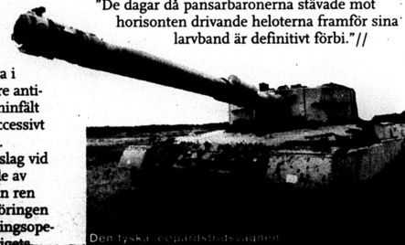
Den tyska leopardstridsvagnen

"De dagar då pansarbaronerna stävade mot horisonten drivande heloterna framför sina larvbänd är definitivt förbi."//