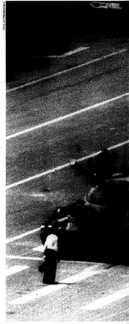
En ensam kines, endast beväpnad med en plastpåse, försöker

"Egendommeligt nog var stridsvagnen ursprungligen ett marint utvecklingsprojekt"