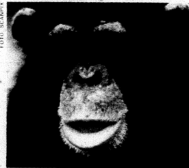
Var det ett poliovaccin förorenat av schimpansviruset SIV som gav människan aids?

Infektionssjukdomarnas långa terrorvalde tycktes närma sig sitt slut. I utvecklingsoptimistisk yra krävde Världshälsoorganisationen, WHO, 1977: "Hälsa åt alla år 2000". WHO:s första korståg inriktades mot smittkoppor. 1980 ansågs segern vunnin och organisationen rekommenderade sina medlemmar att sluta vaccinera mot variola. Det definitiva utrotningshotade smittkoppsviruset tillbringar nu sina sista dagar i ett naturreservat i Moskva och ett i Atlanta. Meningen var att de sista av sin art skulle likvideras för gott den 30 juni 1999. Så blev nu inte fallet, bland annat därför att man hade observerat en tidigare okänd form av elakartade apkoppor och därför att ryssarna av suspekta skäl hade börjat gräva upp smittkoppslik ur den sibiriska permafrosten.