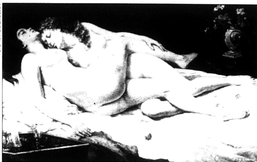
Lättjan och vällusten av Gustave Courbet, Nationalmuseum.

Här hittar man Paul Santhos, sobert formgivna tandborstar med tillhörande tandkrämstuv i vitt och svart, hans tandborstställ för fyra i elegant vägförmat stål (för bara 800 kronor) och ett snarast skulpturalt ställ med tillbehör för manuell rakning.