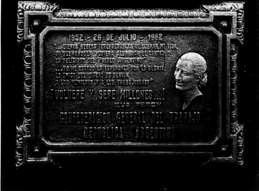
Evitas vila. Överst ses Evita Peróns balsamerade kropp i Buenos Aires sedan den återförts till Argentina från Italien 1974, nästan 20 år efter hennes död. Därunder hedrande plaketter från Peróns mausoleum i Recoleta.

efter tre månader fick hon sitt första radiojobb och sedan hankade hon sig fram som en tredje klas-sens skådis i historiska pekorar. Fyllda 25 mötte hon den vite prinsen – resten är historia. Vid 29 drabbades hon av livmodercancer och efter en heroisk döds-kamp, som följdes av hela Argentina, dog hon 33 år gammal (som Jesus och Alexander) reducerad till 37 kilo. Perón föll tre år senare, 1955, och återkom 1973 iförd en Evita II, en nattklubbssansös, för den slutliga spökdansen.